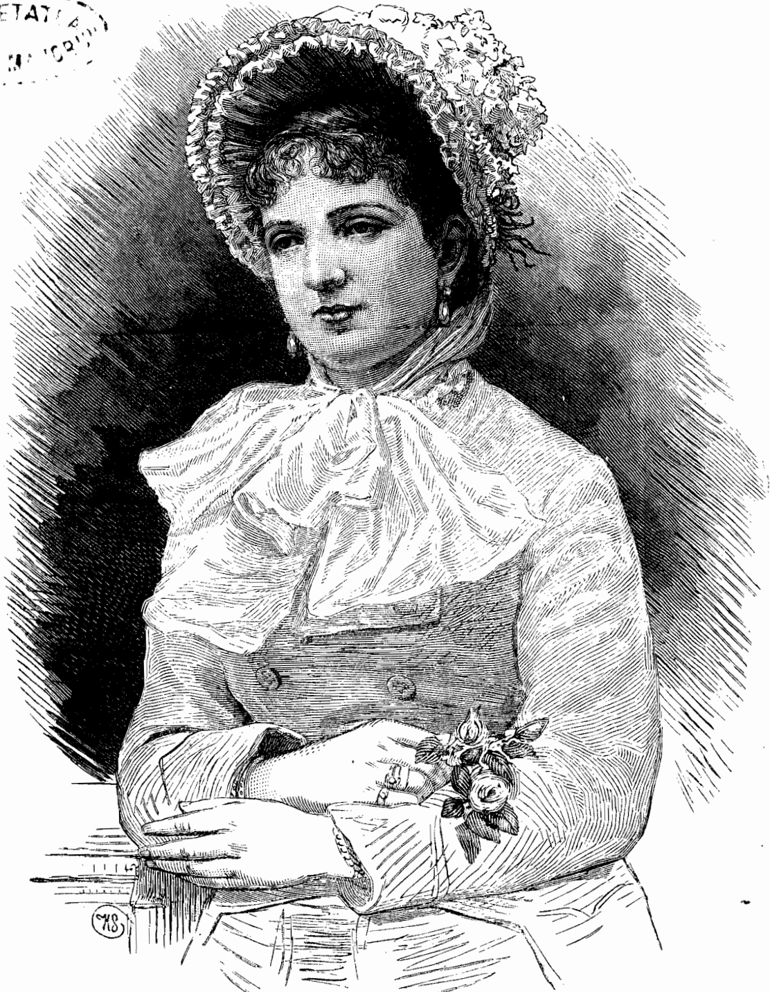
Margaret'a regin'a Italiei.