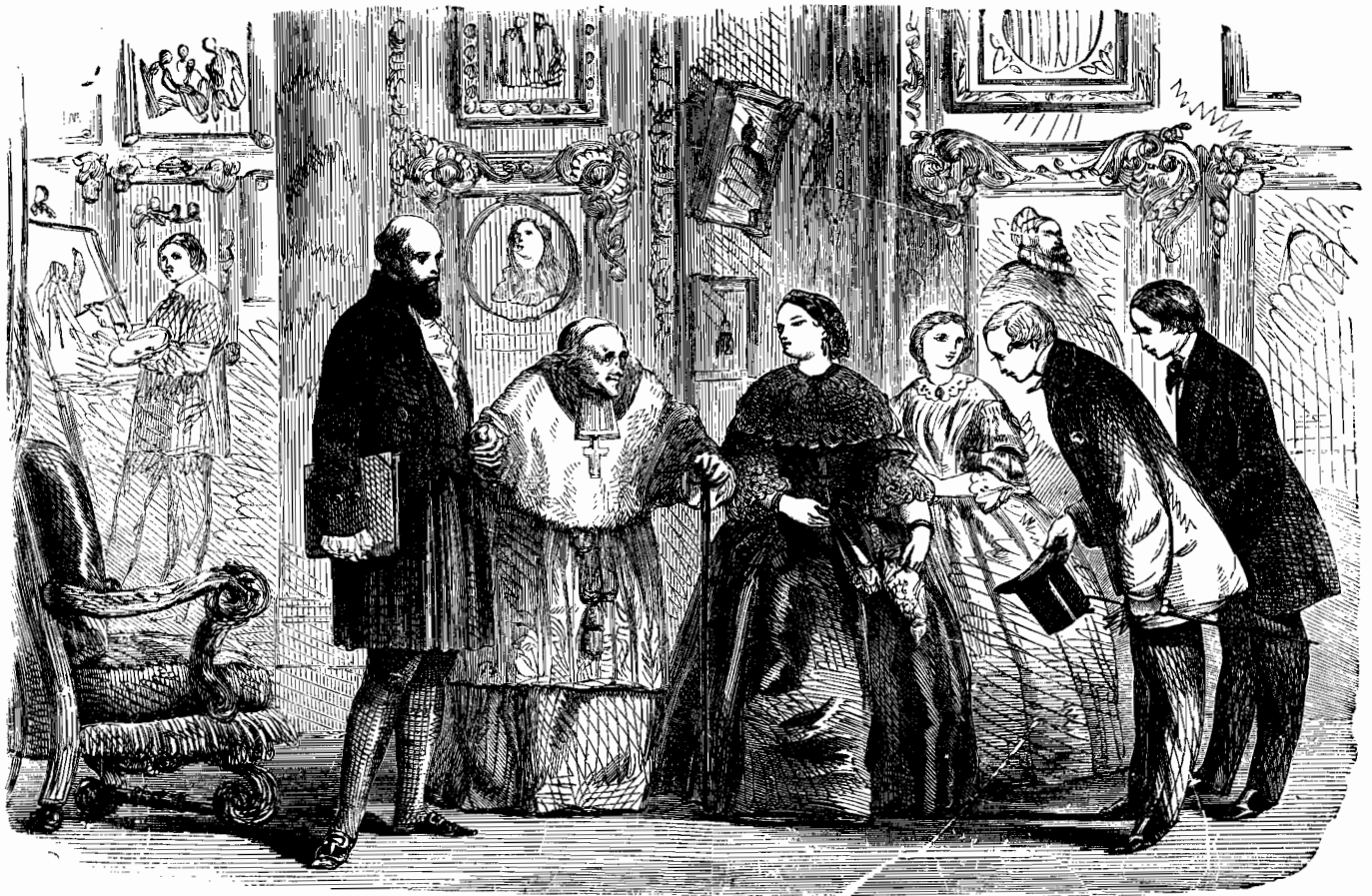
Când ei întrara la preotul, acolo deja așteptau două femei și unu barbatu.

Cum sè nu-l fi serbatu!? Acuma a devenitu dên- sul adevératu colegu al lor. Cum sè nu fi platitu el bu- curos!? Acuma credea, că a facutu celu mai bunu pasu de când a venitu de acasa! Si cum sè nu fi primitu ca- maradii cu placere, când între toti numai Barbu avea parale?