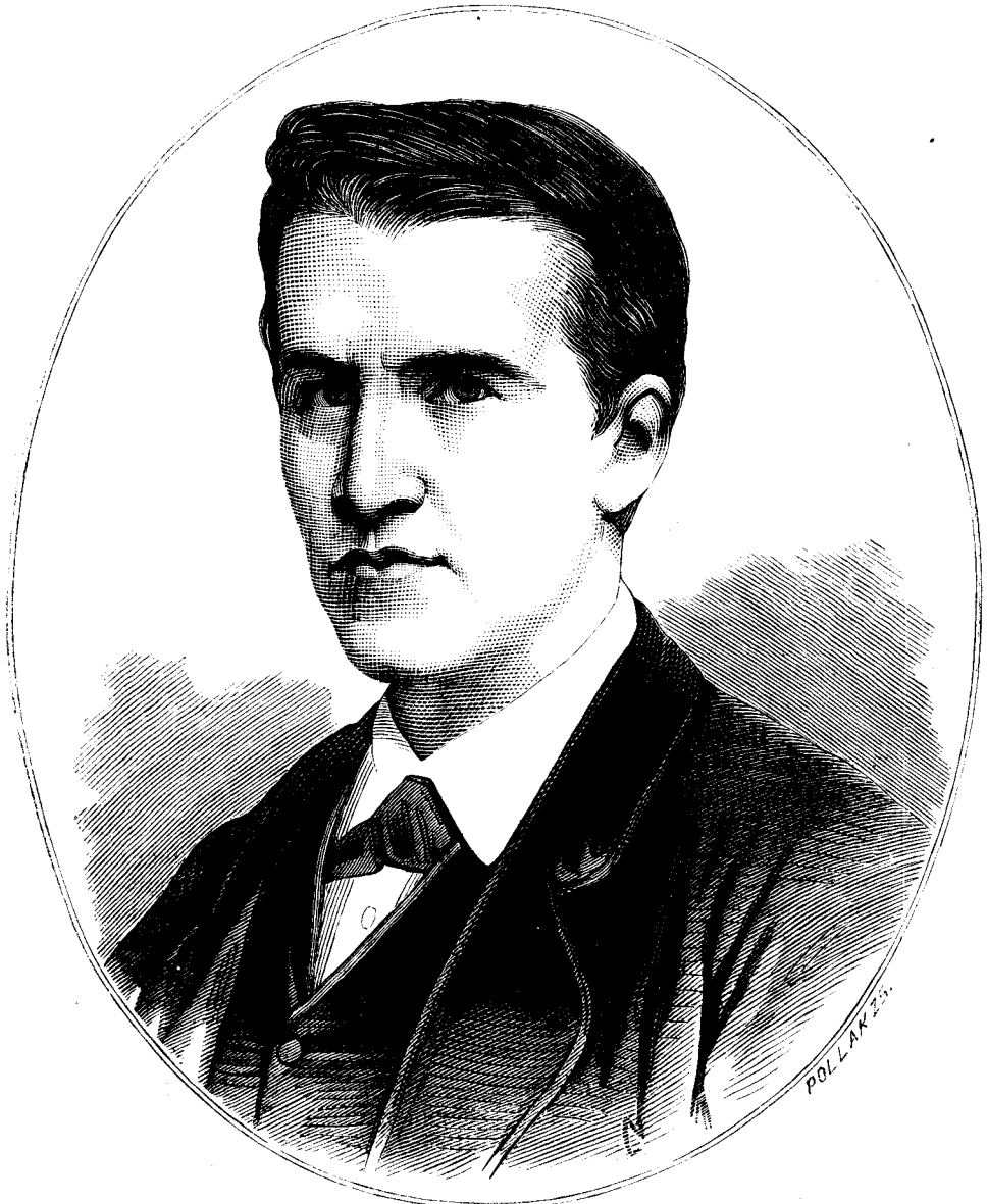
Edison inventatorul luminei electrice.

Sultaniț'a : De ce ? Din o cauza fórte simpla. Pentru cà în limb'a româna înca nu avemu tôte espre- siunile.