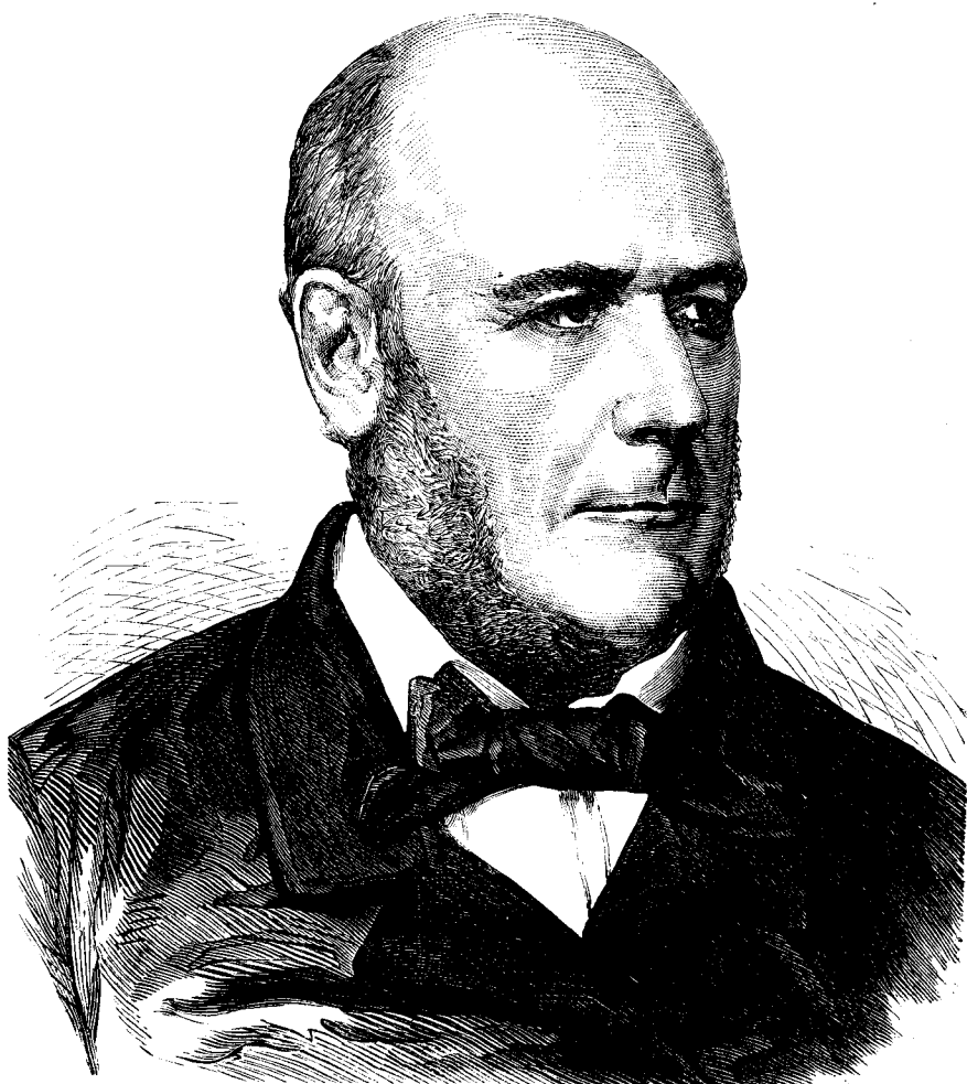
Grévy, noul presiedinte al republicei franceze.

Smaranda : Vreu să stai acasa . . . Séu mai bine vreu să te duci să cauti în tóte părțile pe Nero, si să mi-l aduci negreșitu.