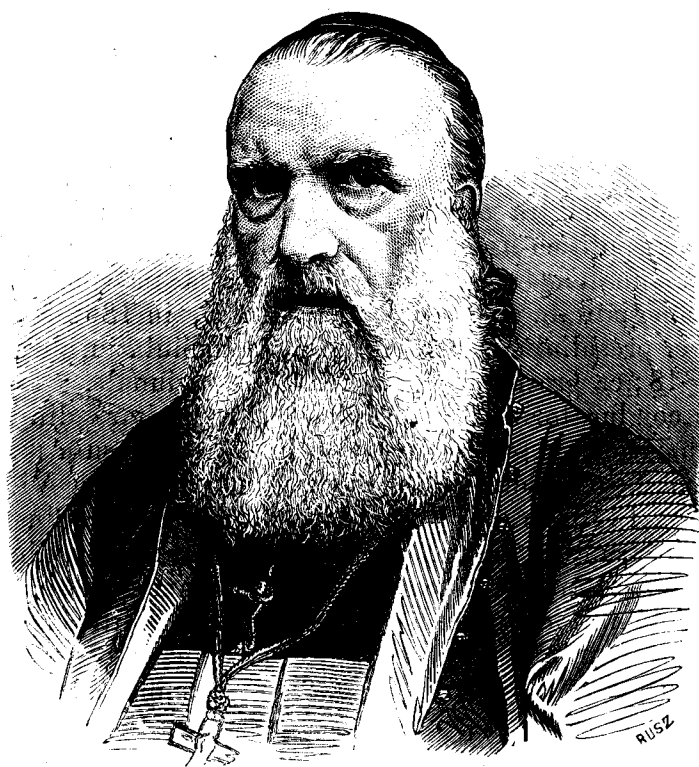
Andrieu bar. de Siaguna.

Escelandu elu inca din prim'a sa cariera pe terenulu bisericescu cu unu talentu raru, si inzestratu fiindu de la natura cu unu esterioru placutu, atrase curundu atentiunea renumitulu pe atunce metropolitu serbescu Stratimiroviciu, care-lu si chiamâ la Carlovietiu in calitate de profesoru semina-