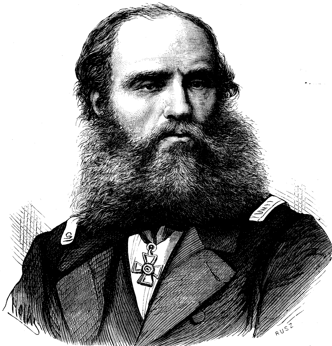
Vice admiralulu Tegetthoff.

Pretiuu pe anu 10 fl., pentru Roman'a 2 galbeni.