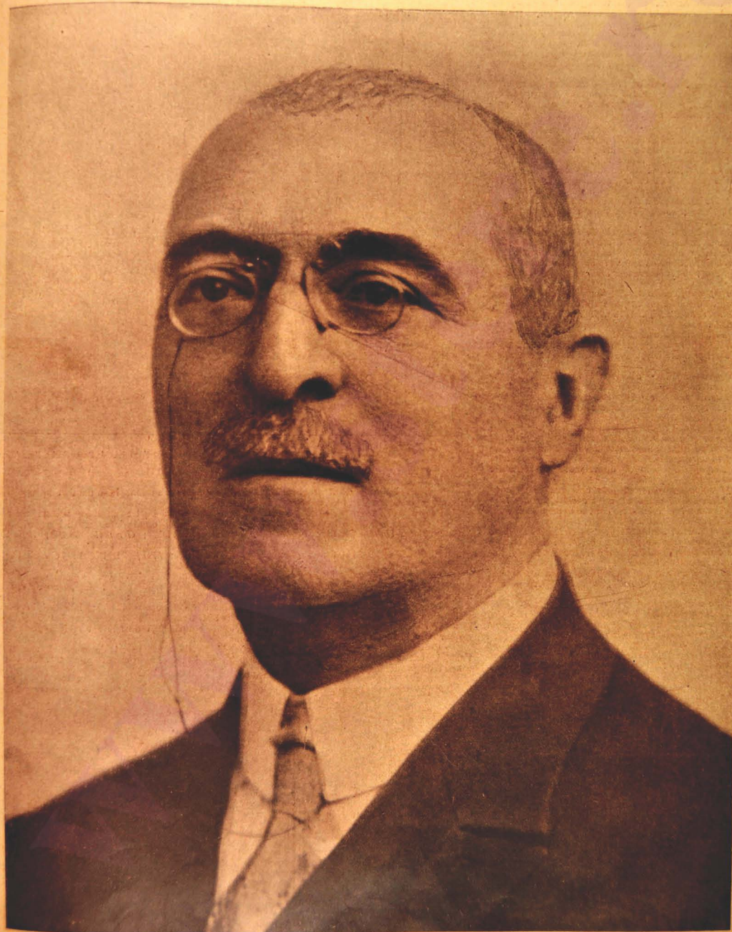
D-I CONSTANTIN SARĂȚEANU Înalt Regent, ales în ziua de 9 Octombrie 1929